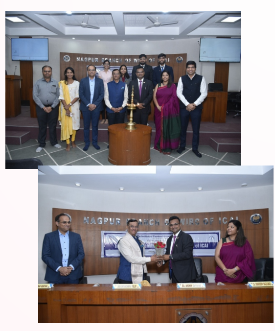
Spearker - Shri Dnyaneshwar Mulay Member of National Human Rights Commission, New Delhi