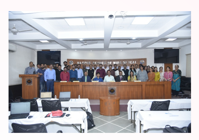
Workshop on Power BI & Power Query Master Class